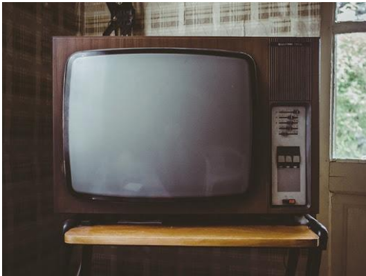
Medio de comunicación en el siglo XIX