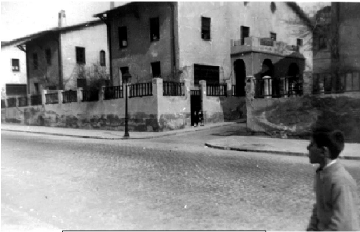
Casa en el siglo XIX

Habitan en los "barrios bajos", hacinados, en condiciones insalubres, la mayoría en la total miseria. A finales del siglo XIX surgen los primeros barrios residenciales, los bloques de viviendas de estilo ecléctico, los chalés y las ciudades jardín para la burguesía.