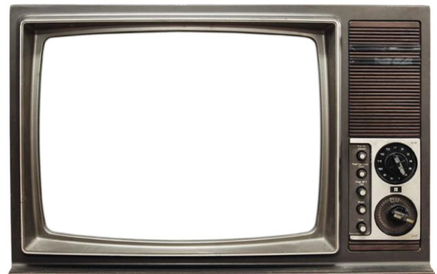
Medio de comunicación en el siglo XX

Actividad: Después de haber observado las imágenes sobre los cambios que surgieron entre un siglo y otro, vas a escoger una de las transformaciones que acabas de ver y vas a buscar información relevante de una de las transformaciones. Por ejemplo, la televisión del siglo XIX con el XX ¿Qué cambios se produjeron? ¿Cómo funcionaban en esas épocas? Lo ideal es que sea un cuadro comparativo.