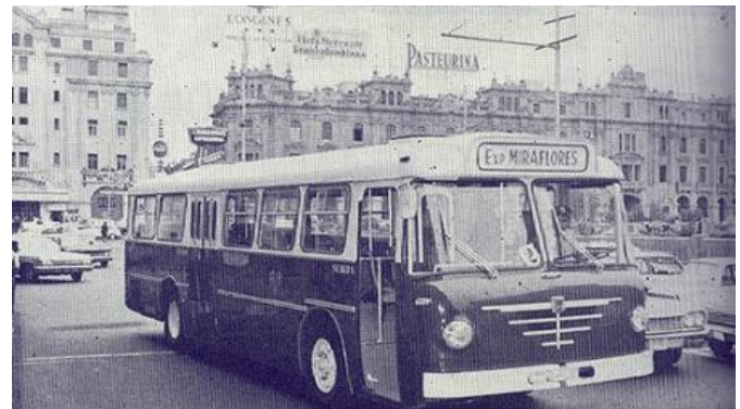
transporte en el siglo XX