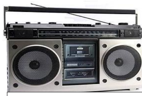
Medio de comunicación en el siglo XX