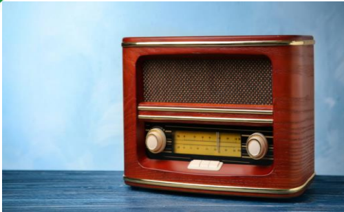
Medio de comunicación en el siglo XIX