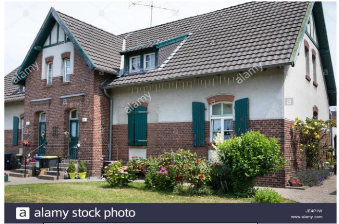
Casa en el principio del siglo XX